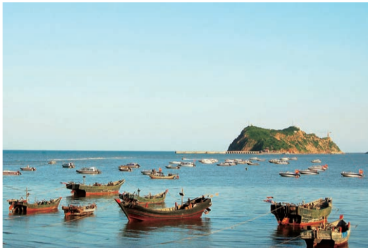
辽西风光