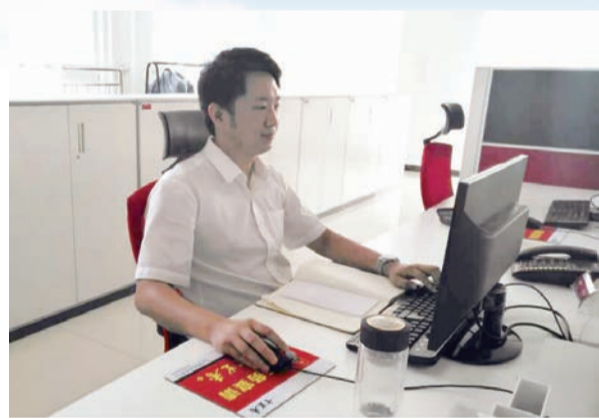
十年十里香的宏伟蓝图迈进!

十里香喜迁十里香大厦也实现了从发酵园、66°体验馆、到十里香大厦一系列重点工程的建设。这在十里香的历史上也留下了浓墨重彩的一笔,71年的十里香正焕发出新的生命力,正在朝着百