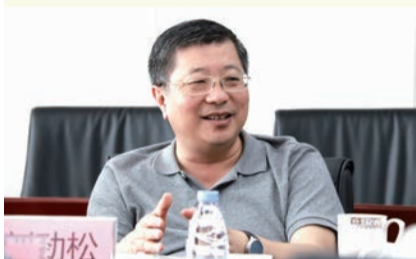
▲河北省工商联主席、省总商会会长刘劲松